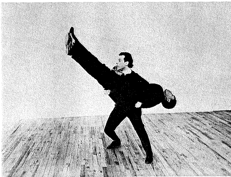
Bill T. Jones en Arnie Zane