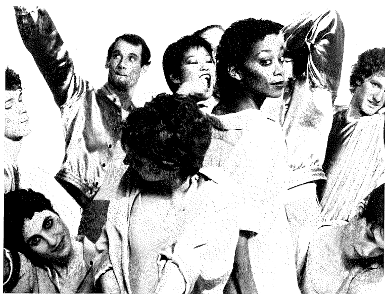
Boven: 'Baker's Dozen' Onder: 'Ocean's Motion'