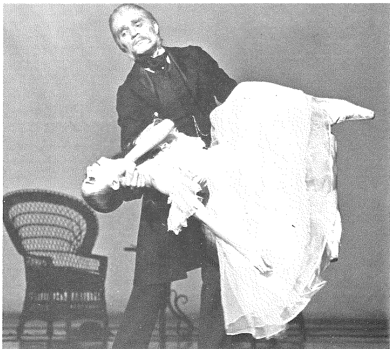
Scènes uit 'Kameliendame'