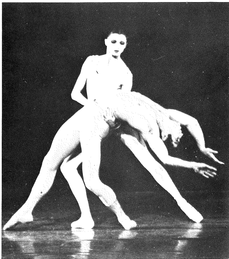
Scène uit 'Opus I'

Choreografie John Cranko Muziek Edvard Grieg, Suite voor strijkorkest, opus 40