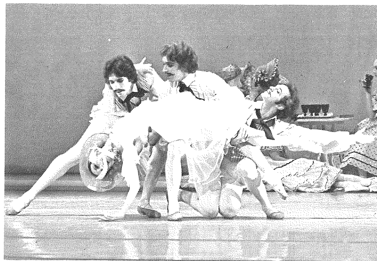
Scène uit 'Kameliendame'