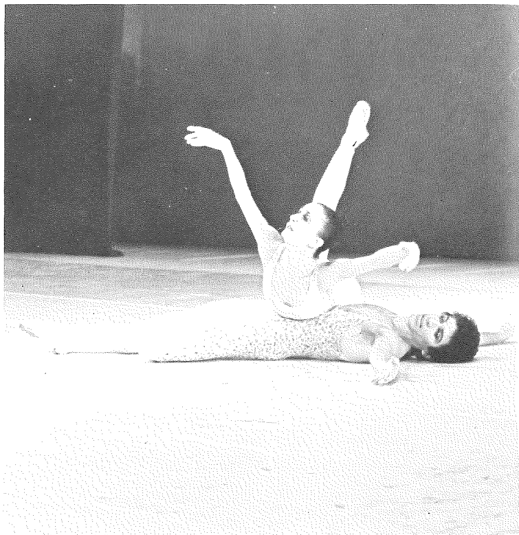
Scène uit 'Voluntaries'

'Voluntaries' worden in de muziek vrije orgel-improvisaties genoemd, die men voor, tijdens of na de eredienst speelt. De Latijnse wortel van het woord kan ook vlucht of verlangen betekenen. Het ballet is als een reeks 'voluntaries' gedacht.