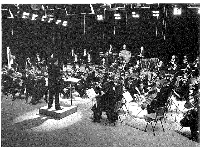
Boven: Het Omroepkoor Onder: Het Radio Filharmonisch Orkest

14 juni Amsterdam, Concertgebouw, 20.15 uur