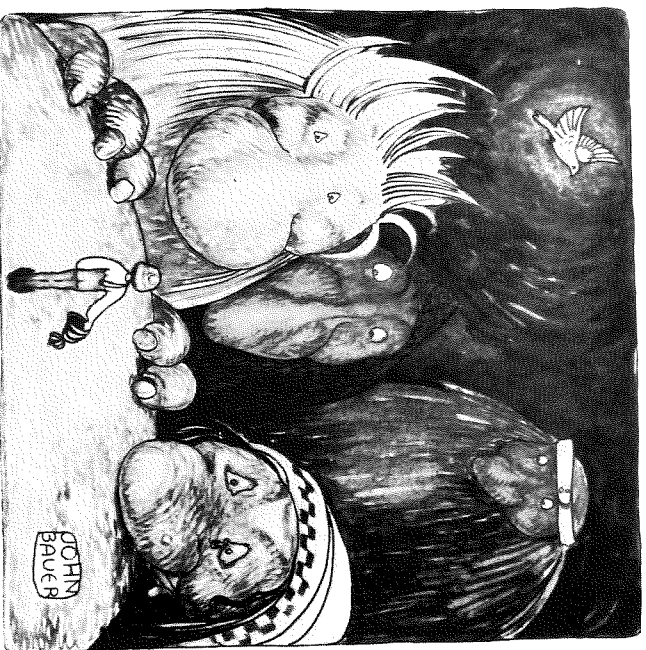
Illustratie uit 'De Sprookjeswereld' van John Bauer (Uitgeverij Lemniscaat & Rotterdam)