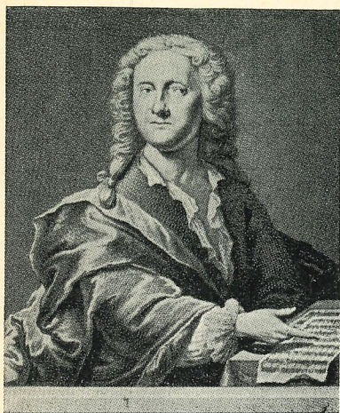
G. Ph. Telemann