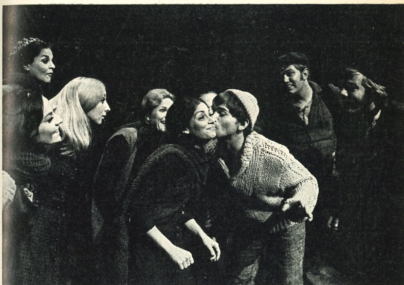
Songs from the Milkwood

Het National Theatre of the Deaf is een typisch-Amerikaans theaterfenomeen, dat uit idealisme en praktische zin geboren is. Het richt zich op het algemene toneelpubliek en wil als ieder ander toneelgezelschap beoordeeld worden. Een belangrijk neven-aspect van zijn bestaan is echter het sociale motief om doven te integreren in maatschappelijke en artistieke processen en om begrip te kweken voor revalidatie en modern dovenonderwijs. Het optreden in Nederland wordt georganiseerd in samenwerking tussen het Holland Festival en de NCRV-televisie.