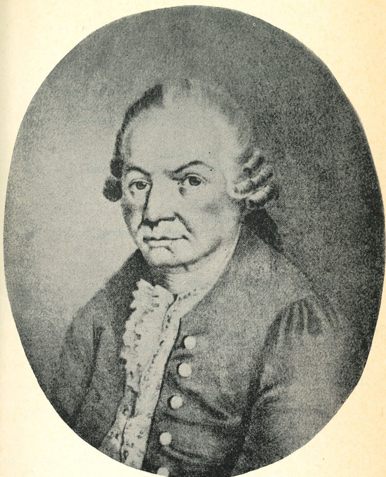
C. Ph. E. Bach

voorschreef was uitgebreider dan bij zijn vader, alhoewel deze reeds veel plaats had ingeruimd voor de blazers met name door de introductie van hoorns en klarinetten. Maar wellicht was Carl niet alleen een goede leerling van zijn vader maar ook een goed kenner van de italiaanse symphonische erfenis. En deze legde niet zozeer het accent op het thematisch dualisme eigen aan vader Stamitz's eerste klassieke symfonieën – en vooral dan in het eerste deel – maar meer op het concernerend (duellerend?) karakter tussen twee of meer instrumenten in samenspraak met het orkest. In de lijn van de combinatie van beide invloeden: klassieke symfonie in de kiem en erfenis van het concerto grosso, moeten wij de concertante symfonieën bezien en beluisteren zoals Carl Stamitz ze nagelaten heeft.