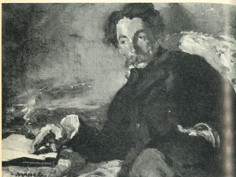
Portret van Mallarmé door Manet

'Zeitmasse' for five windinstruments belongs to a period in which Stockhausen, in contrast to his earlier works where everything was concentrated on the isolated and individual tune, began to seek higher group-units he called 'Gruppen'