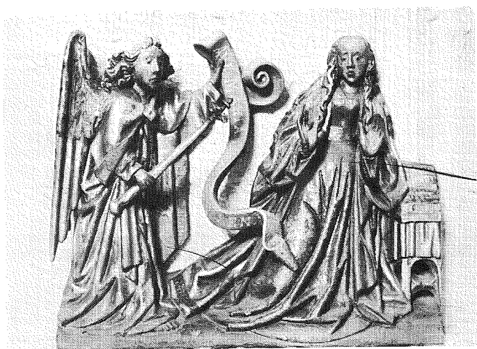
Annuntiatiegroep van het Lijdensaltaar in de Kathedrale Basiliek van St. Jan. (Antwerpse school ± 1500.)

Wees gegroet Maria, vol van genade de Heer is met U, zuivere maagd.