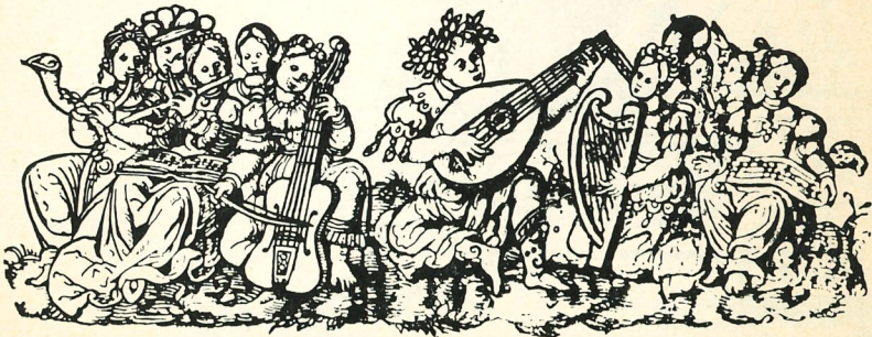
Een groep musiciennes (kromhoorn, fluit, viola, harp) rondom een luitist die een zangeres begeleidt. Gravure uit 'Hortus musarum', uitgegeven door Pierre Phalèse in 1553