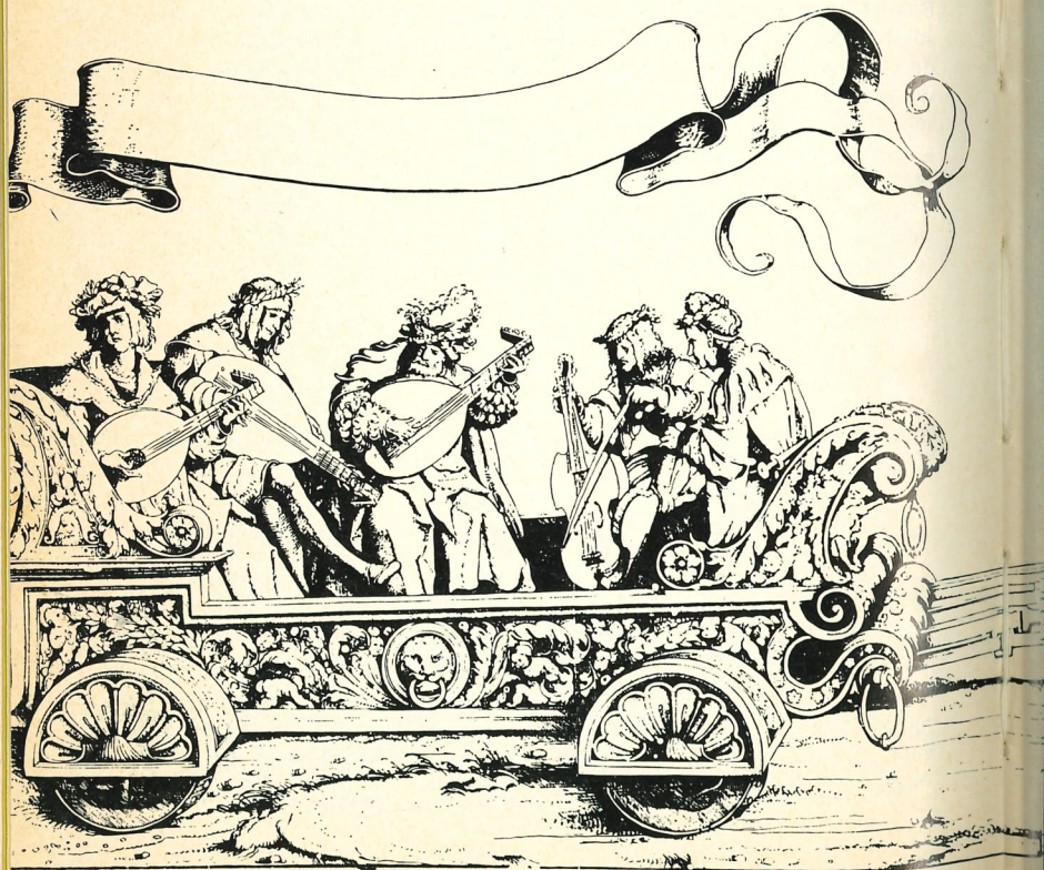
Musica Lauten und Rybeben op een wagen uit Keizer Maximiliaans 'Triumphzug' (Wenen, Oesterr. Nationalbibl., Codex Min. 77)

2e stem Nun kumbt hieher all und helft mir einmal in diesem Saal, wem's läuten g'fall', und zeicht an bald, treibt wenig G'schall. Nit irret mich, sunst hör' auf ich. Flux, fuder dich. Ich mag nicht läuten lang. Bitt'ich mir sag', was ist für Tag, was hab'wir heut', dass man so läut'. Solch's Gläut macht mich betörn, ich mag mich selbst nit hörn. Schau'eben auf, zeuch gleich mit auf. Nun läut't zam in Gottes Nam'. Wer kommen will, darf g'läuts nit viel, mag her treten, ungebeten zue der Metten.