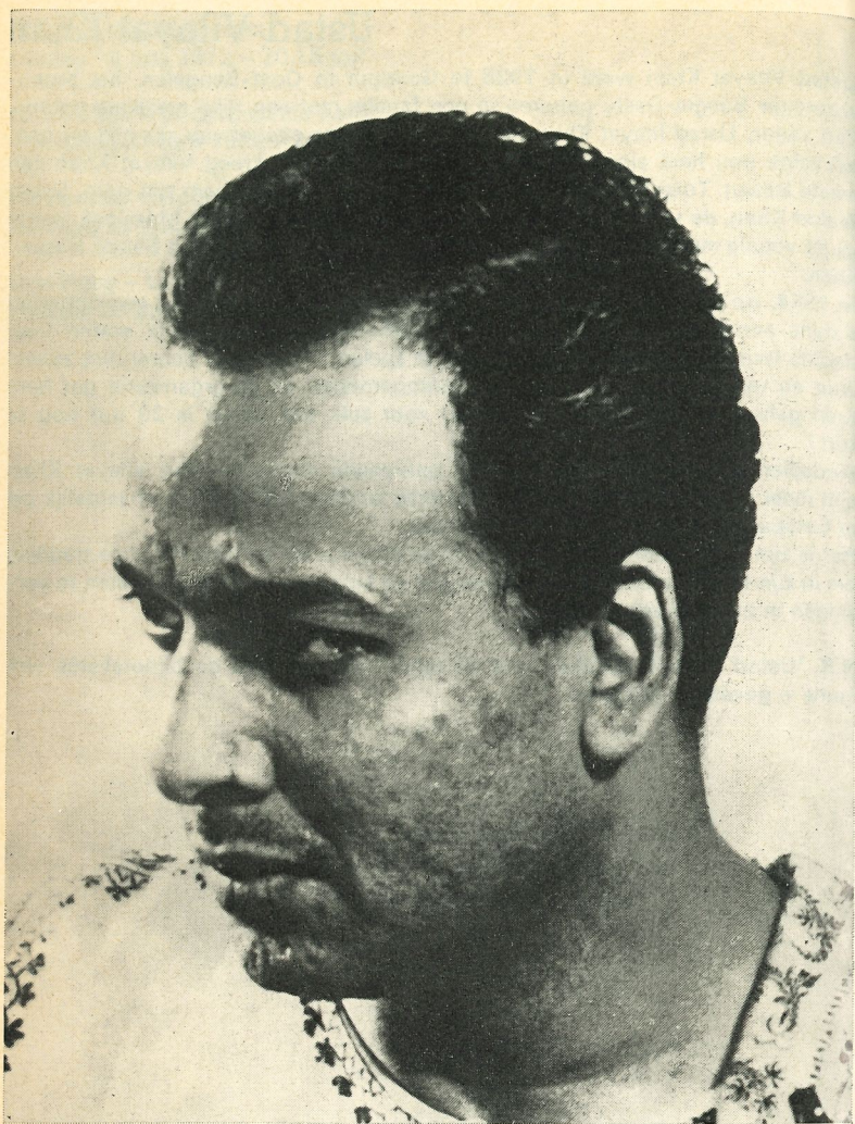
Ustad Vilayat Khan