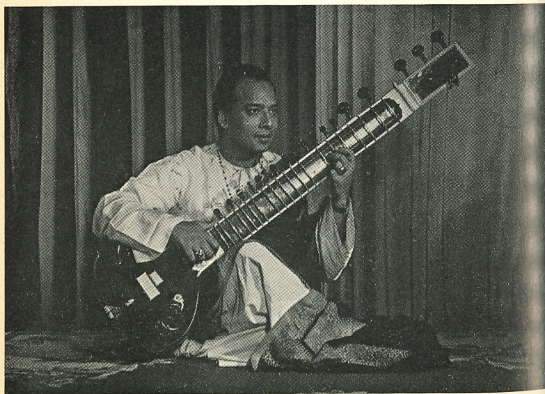
Ustad Vilayat Khan.

Als de gat wordt ingezet, begint de tabla-speler zijn spel met enig vertoon van zijn kunnen. Hij speelt een aantal ritmische variaties, die met een kleine climax uitkomen op het hoofdaccent van de gekozen maatsoort. Pas daarna speelt hij het grondpatroon van de tala, de zogenaamde 'theka'. Dan is het de beurt aan de sitar-speler om variaties en improvisaties te gaan maken op de compositie en de raga. Als hij weer terugkeert naar de compositie zelf, kan de tablaspeeler op zijn beurt weer gaan variëren – vaak geïnspireerd door de ritmische aspecten van het sitar-spel, dat hij zojuist gehoord heeft. En zo wisselt men elkaar af. Voor een ingewijde toehoorder is het boeiend om te ervaren hoe sitar- en tabla-speler na allerlei melodische en ritmische escapades toch weer uitkomen op het hoofdaccent van het maatschema, de 'sam'. Er zijn composities die speciaal zijn bedoeld voor een vertolking in een langzaam (vilambit) tempo en andere voor een snel