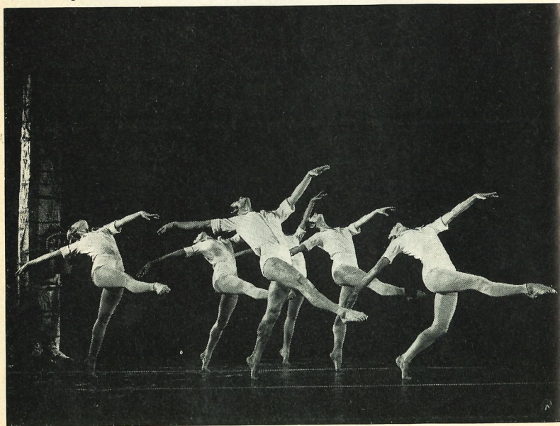
'In a Clearing'

'Sinfonia' wordt concertant integraal uitgevoerd op donderdag 22 juni in De Doelen in Rotterdam, onder leiding van de componist, door het Rotterdams Philharmonisch Orkest met medewerking van de Swingle Singers, in het raam van de speciale Berio-concerten in het Holland Festival 1972.