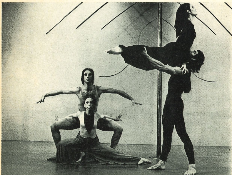
'The song of Deborah'