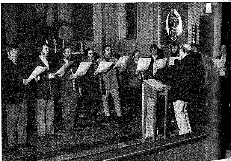
Pro Cantione Antiqua, Londen

Ontwerp omslag Gielijn Escher Druk en lay-out J. F. Duwaer en zonen b.v. Amsterdam