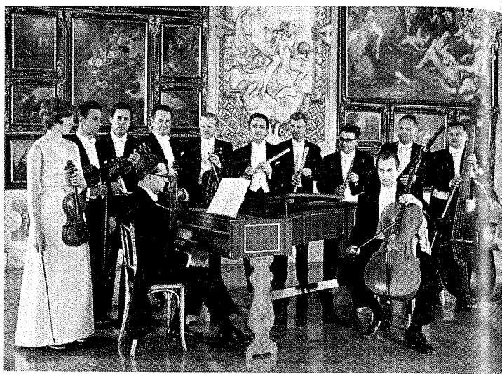
Concentus Musicus, Wenen