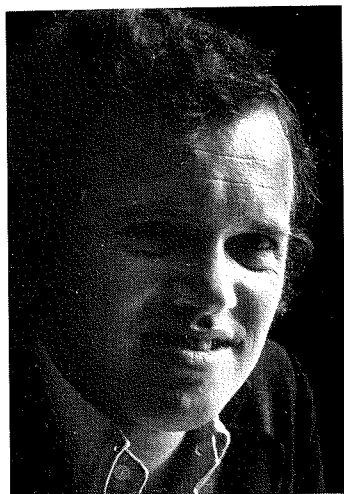
Edo de Waart