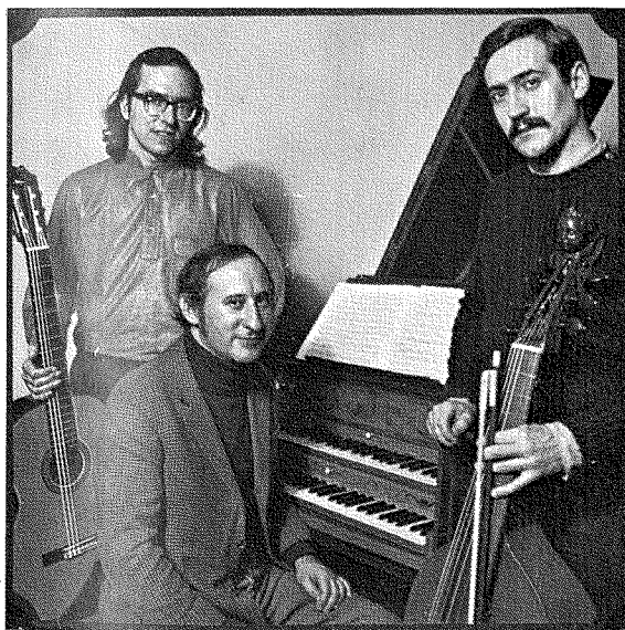
John Williams, Rafael Puyana en Jordi Savall

Zijn grammofoonplaten werden onderscheiden met de Grand Prix du Disque, de Annual Grammy Award en de Deutsche Schallplattenpreis.