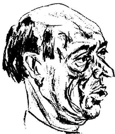
Alban Berg en Arnold Schönberg