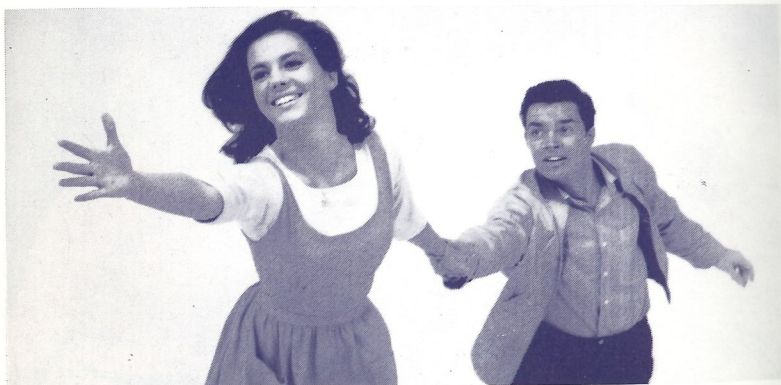
„There’s no place for us”: Natalie Wood en Richard Beymer in de filmversie.

Bernsteins muziek, geschreven voor een theaterorkest van 25 man, werd bewerkt voor een symfonie-orkest van 75 man door Saul Chaplin. „Something’s coming”, „Cool”, „America” en andere songs zijn zo elektrificerend, dat men mag hopen dat Bernstein zich nog eens aan het schrijven zet. (Philips BBL 7277)