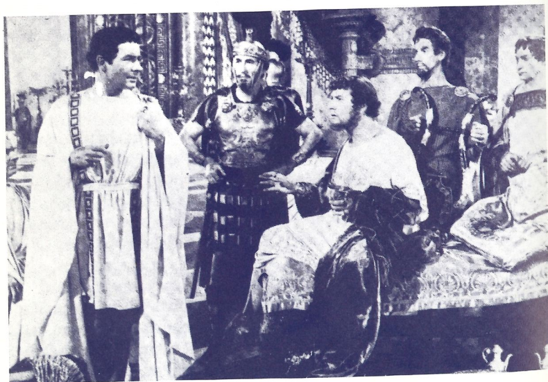
Peter Ustinov als keizer Nero in „Quo Vadis”.