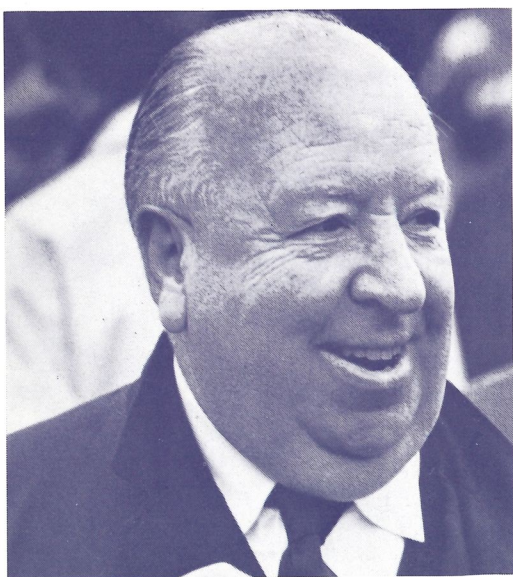
Alfred Hitchcock werd in zijn ijzingwekkende beeldvondsten muzikaal gevolgd door Herrmann.

Toen „Marnie” commercieel niet zo'n succes werd, dwongen de studio's Hitchcock (ondanks diens protest) tot een scheiding van Herrmann. De komponist, die in 1911 in New York geboren was, woonde de laatste jaren van zijn leven in Londen. Zijn eerste filmscore, voor Orson Welles' vermaarde „Citizen Kane” in 1941, schonk hem een brede reputatie. Hij werkte ook nog voor Truffaut en Pim de la Parra's „Obsessions”. (Decca PFS 4173)