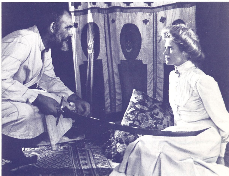
Candice Bergen als Amerikaanse de gevangene van Berber-hoofdman Sean Connery.

The International Filmguide 1972 koos hem tot komponist van het jaar. Algemeen werd zijn muziek, die het karakter van de in zichzelf verdeelde generaal Patton karakteriseerde, als zijn beste werk gerekend, maar ook „The wind and the lion”, waaruit een suite werd samengesteld, oogste lof.