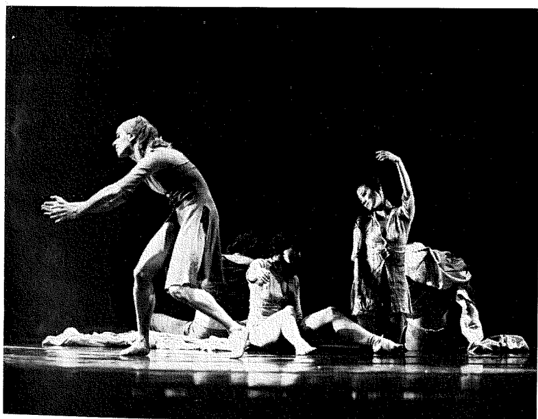
Ballet Rambert: Ancient Voices of Children