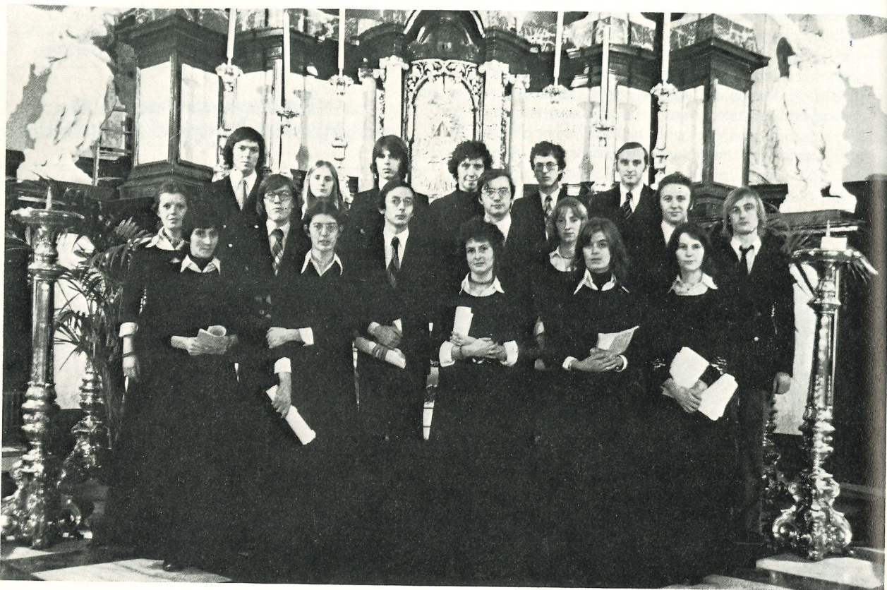
Collegium Vocale Gent

ken. Datzelfde doodsklokken-effekt gebruikt Bach vaker, o.a. in cantate 161, 'Komm du süsse Todesstunde', en mogelijk heeft hij het ook voor ogen gehad bij de tekst 'Bestelle dein Haus, denn du wirst sterben' in de 'Actus tragicus', een van zijn allereerste cantates en tevens een van zijn meest indringende werken op dit gebied. Met een minimum aan middelen, vierstemmig koor, solisten (vrijwel zeker uit het koor), twee blokfluiten, twee gamba's en basso continuo, bereikt hij een maximum aan expressie. De gelegenheid waarvoor Bach deze cantate heeft geschreven is niet bekend.