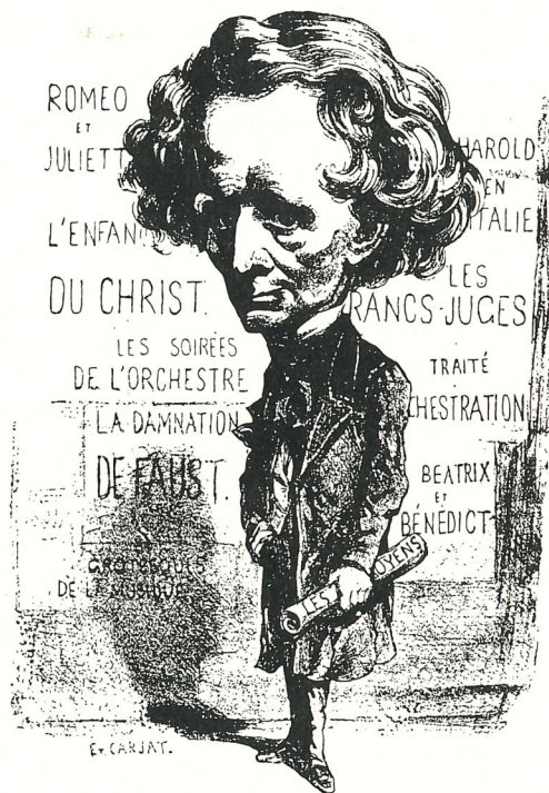
Sektor Berlioz

* Voor de niet ingewijden: Berlioz bezocht in Parijs een engelse Hamlet-voorstelling met Harriett Smithson in de Ophélie-rol. Hij raakte jarenlang in haar ban. Pas in 1832 na de uitvoering van de Fantastique-Lelio leren zij elkaar kennen. Berlioz wilde haar tot trouwen dwingen door zich in haar bijzijn te vergiften. Berlioz: 'Vreselijke kreten van Harriett. Verheven vertwijfeling! Wreed gelach van mijn kant. Verlangen weer te leven bij het horen van haar verschrikte verzekering van liefde! Braakmiddel. Ipekaquana! Twee uur lang overgeven! Slechts twee korrels opium bleven achter. Ik was drie dagen lang ziek, maar heb het overleefd'. Men vraagt zich af of in Berlioz' 'Mémoires' zijn 'Fantastique'-toelichting is geslopen of andersom met verplaatsing van tijd. Het hoeft niet verzonnen te zijn. Later gebruikte hij in elk geval narcotica.