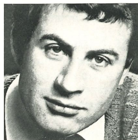
James Bowman René Jacobs