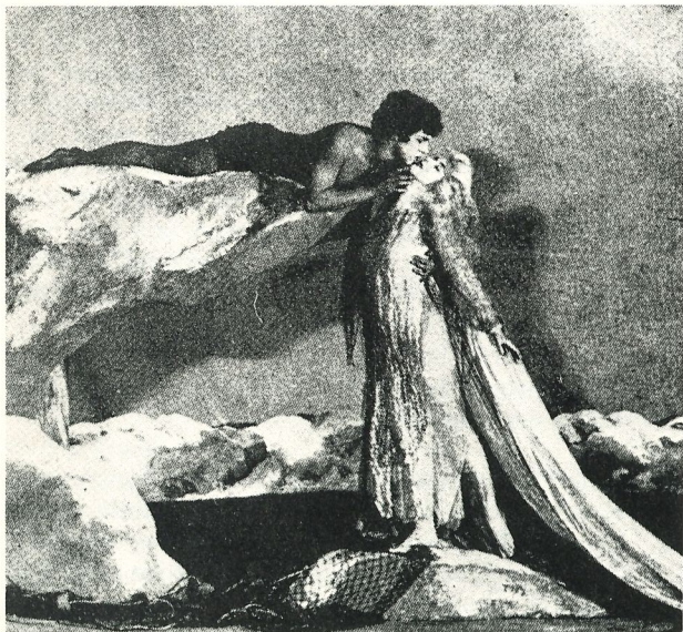
'The Spirit of the Sea', 1923