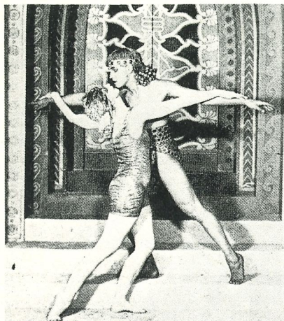
'Ishtar of the Seven Gates', 1923 (St. Denis als Ishtar en Shawn als Tammuz)