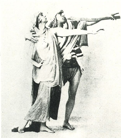
'Ourieda, a Romance of the Desert', 1914; was het eerste duet dat St. Denis en Shawn samen dansten.