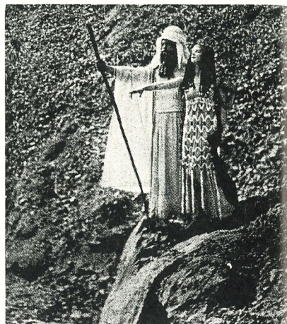
'Miriam, Sister of Moses', 1919 (St. Denis als Miriam en Shawn als Moses)