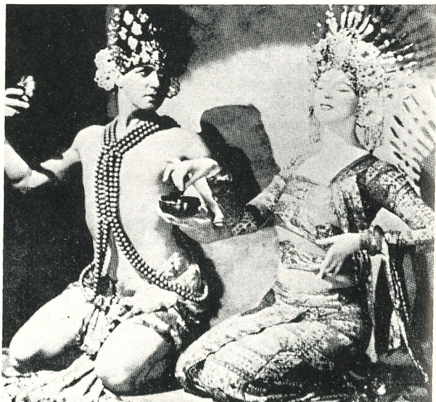
'Balinese Fantasy', 1924