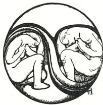
Ruth St. Denis