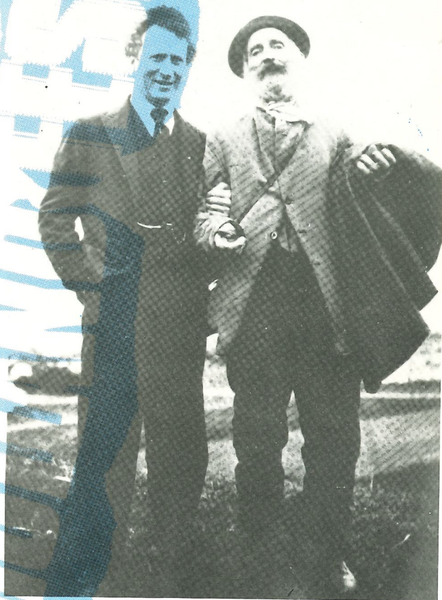
Percy Grainger met Grieg