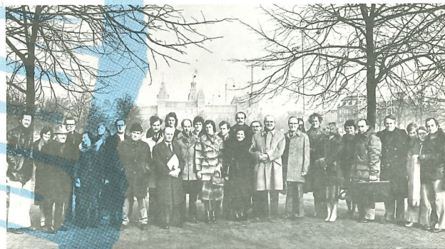
Het Nederlands Kamerorkest

Zojuist is het orkest teruggekeerd van een reis naar Wenen en West-Duitsland o.l.v. Szymon Goldberg, die, naast de pianist Radu Lupu, ook als solist optrad.