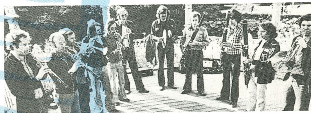
Het Nederlands Blazers Ensemble

Bij dit programmaboekje hoort een handig opberghoesje dat nog veel meer informatie geeft over 'Concerten, opera, muziektheater' in het Holland Festival 1978.