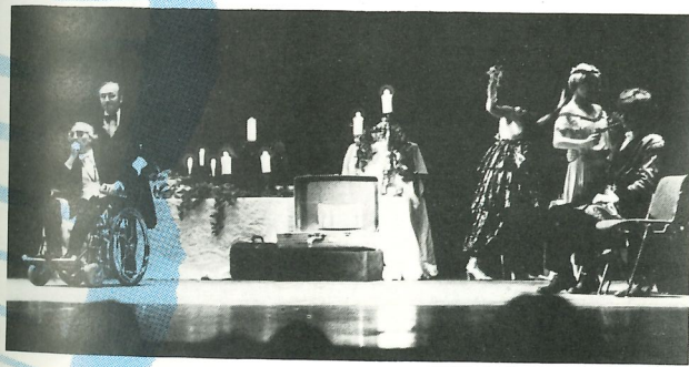
Siegfried über all