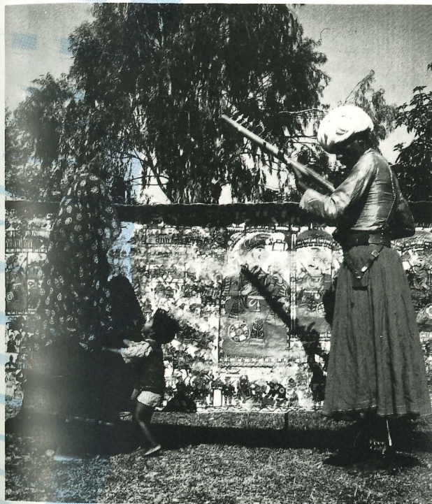
Volkstheater uit Rajasthan