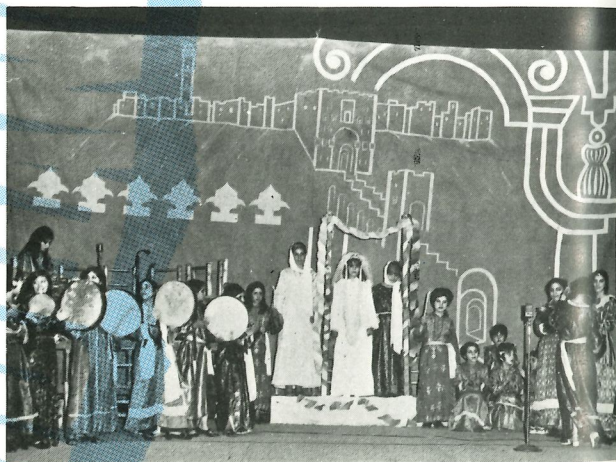
Huwelijksceremonie uit Aleppo, Syrië