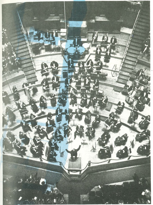
Amsterdams Philharmonisch Orkest