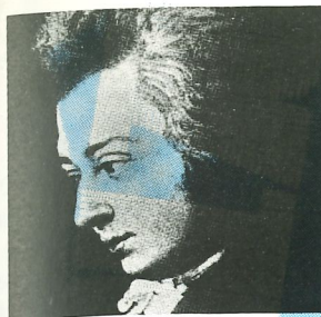
Wolfgang Amadeus Mozart Béla Bartók