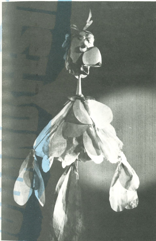
De papegaai uit Ninigra en Aligru