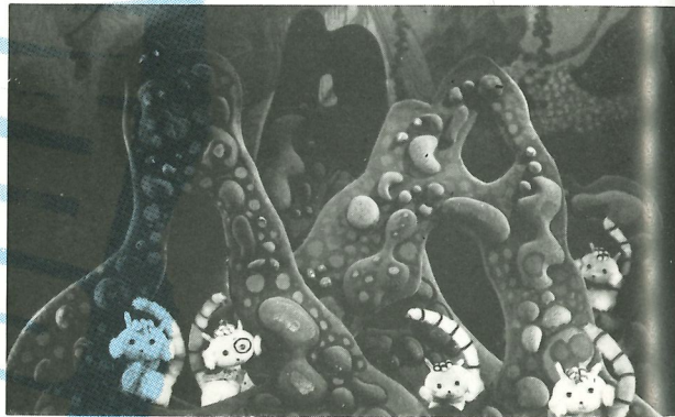
Scène uit Ninigra en Aligru

Twee kleine tijgertjes, Ninigra en Aligru, ontmoeten elkaar in het oerwoud en besluiten samen naar de jaarmarkt te gaan, die in het bos gehouden zal worden. Daar wordt Ninigra onverhoeds geroofd door een stel mysterieuze bandieten. Ze weet te ontsnappen met de hulp van een papegaai die magische krachten bezit, maar ze valt meteen weer in handen van een dubieuze poezenmadam die samen met haar knecht, een vervaarlijke kater, kleine tijgertjes zowel een hersen- als een vachtspoeling geeft om hen te transformeren in kleine poesjes. De gekidnapte 'poesjes' moeten leren bedelen en andere minder fraaie activiteiten onder de knie krijgen om tenslotte voor veel geld doorverkocht te worden. Aligru is intussen op zoek naar zijn vriendinnetje en hij komt oog in oog met de vreemdste dieren en gevaarlijkste situaties. Zal het Aligru nog lukken om op tijd de jaarmarkt te bereiken, waar de poezenmadam haar poezen probeert te verkopen?