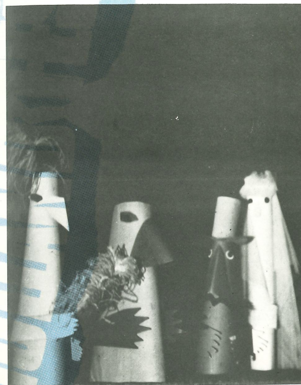
Le théâtre du papier