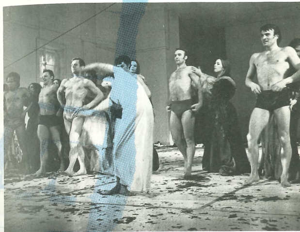
Scène uit 'Blaubart'

Bij het beluisteren van een bandopname van Béla Bartòks Herzog Blaubarts Burg