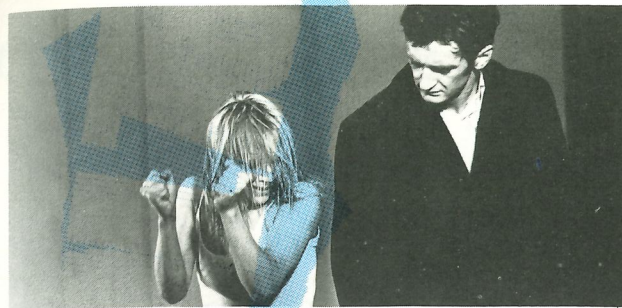
Scène uit 'Blaubart'

Deze sombere problematiek wordt niet alleen door middel van choreografieën uitgedrukt, maar ook via teksten, liedjes en zeer beeldende decors; de bewegingen zijn soms zo simpel dat ze ook door acteurs uitgevoerd zouden kunnen worden. Het resultaat is echter een zeer indringend bewegingstheater, waarmee de Wuppertaler Bühnen naast het ballet van Stuttgart en Hamburg tot de boeiendste dansgroepen in Duitsland behoort.