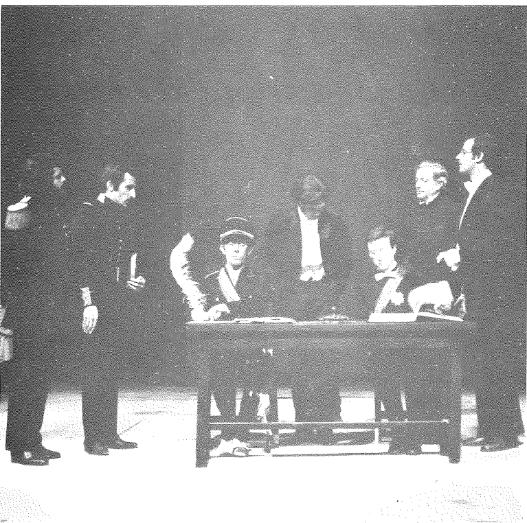
Scènes uit 'Prends bien garde aux Zeppelins'.