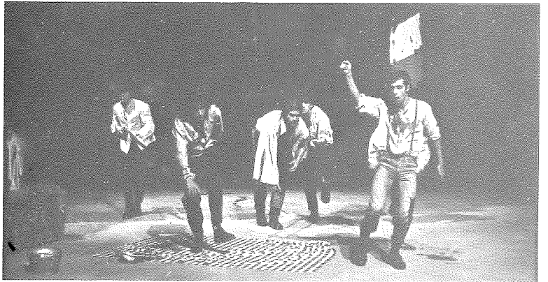
Scènes uit 'Prends bien garde aux Zeppelins'.