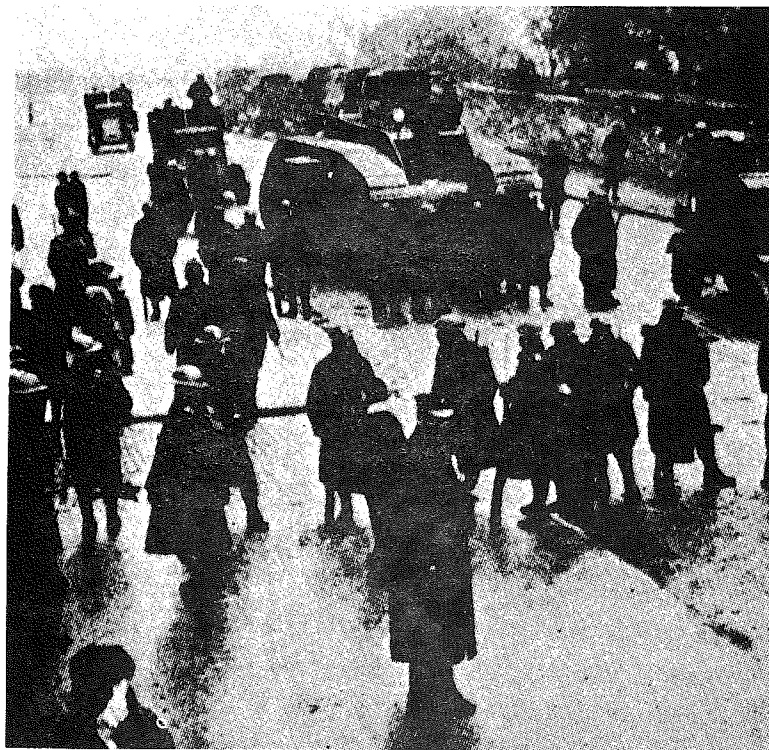
Boven: Republikeinen verwoesten een spoorbaan. Onder: Britse soldaten voor de Mountjoy gevangenis in Dublin.