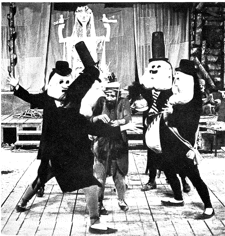
Scène uit De Vrede

Trygaios, een wijnboer, laat door zijn knechten een grote kever vetmesten. Hij weet uit een fabel van Aesopus dat zo'n beest eens naar de hemel gevlogen is. Trygaios vliegt op de rug van zijn kever naar de Olympos en treft daar Hermes aan, de boodschapper van de goden. Alle goden, behalve Polemos, zijn weg, omdat ze genoeg hebben van het geweeklaag van de mensen over de oorlog. Hermes wordt overreed om te zeggen waar Vrede begraven zit. Voor Trygaios naar de aarde terug kan keren met Vrede moet hij haar eerst uit de put bevrijden. Hij roept hiertoe alle eerlijke mannen bijeen om samen met hen eensgezind Vrede te bevrijden uit haar donker hol. Ze willen daarmee verhinderen dat de oorlogsgod geheel Griekenland in zijn vijzel fijnstamp. Trygaios gebruikt dan de enorme afmetingen van Vrede om via haar terug te keren naar de aarde, waar hij hartelijk wordt verwelkomd. Echter niet ieder is tevreden met de vrede. Volgen protesten van politici, wapenfabrikanten en andere oorlogsprofiteurs. Trygaios weet hen echter met veel succes en onder groot gejoel de deur uit te werken. Alle eerlijke en vredelievende mensen kunnen nu aan het grote vredesfeest beginnen. Trygaios gaat voor in een grote bruiloftsstoet waarin hij Opora, een van de begeleidsters van Vrede, als zijn bruid meevoert.