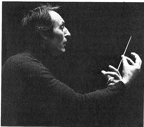
Carlo Maria Giulini

Het Concertgebouworkest leidde hij nog dit seizoen in januari.