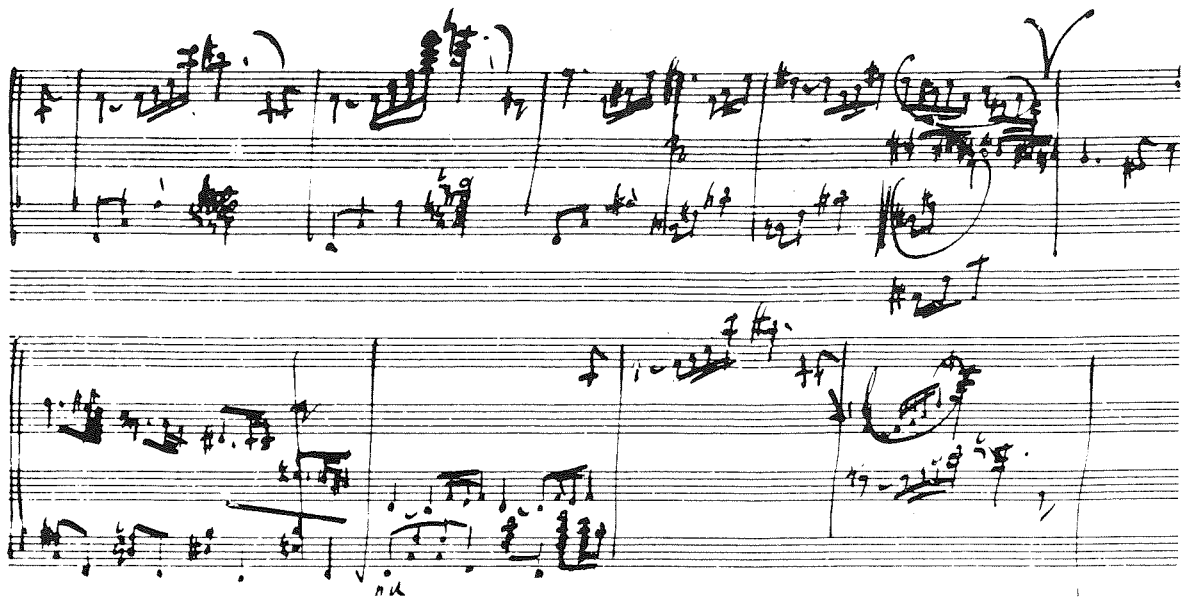
Schets voor het Adagio uit de Tiende symfonie in Mahlers handschrift