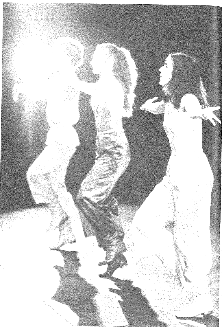
Laura Dean Dancers and Musicians.