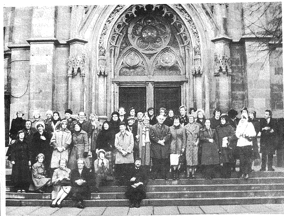
Koor van de Nederlandse Bachvereniging op de trappen van de Thomaskirche te Leipzig.