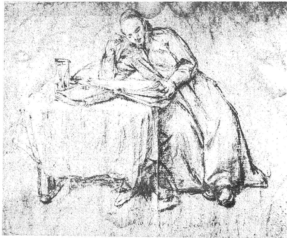
Vivaldi (tekening van Pietro Longhi)