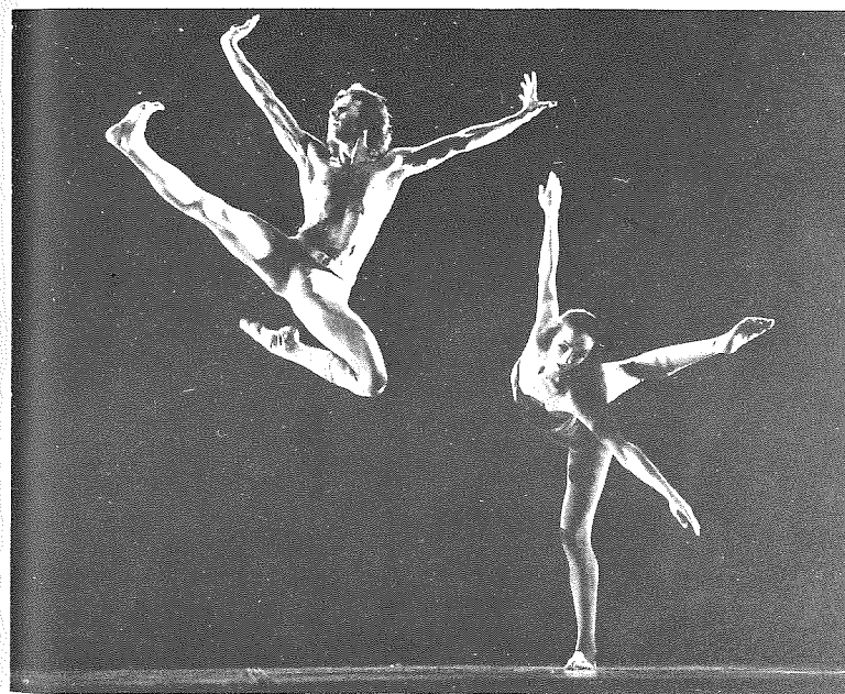
Scènes uit 'Forest' (1977)