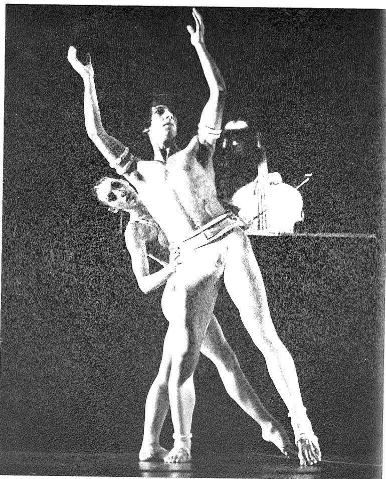
Scène uit 'No man's-land' (1974)