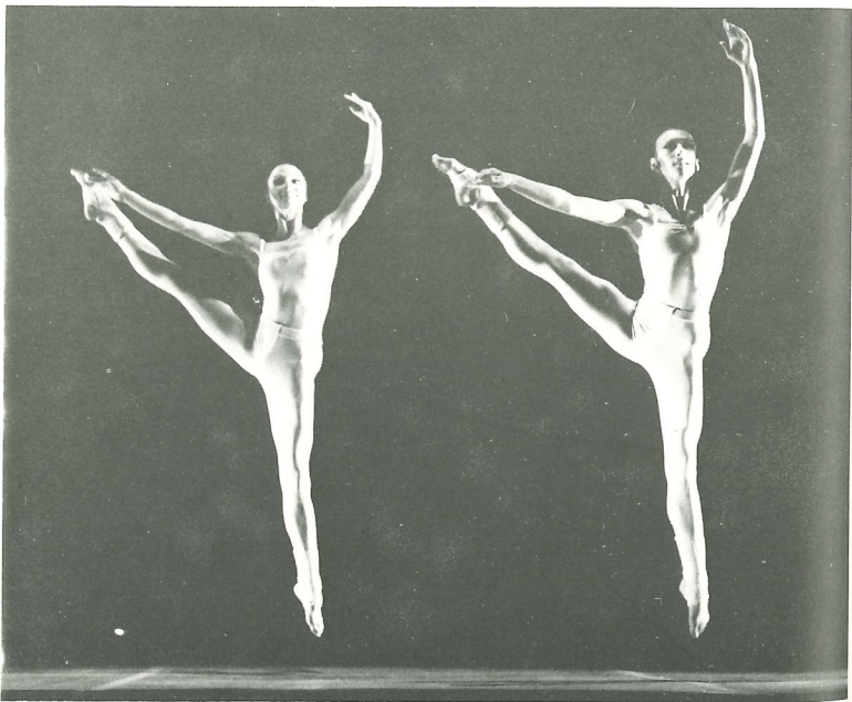
Scènes uit 'Class' (1975)

21 juni Amsterdam, Stadsschouwburg, 20.15 uur