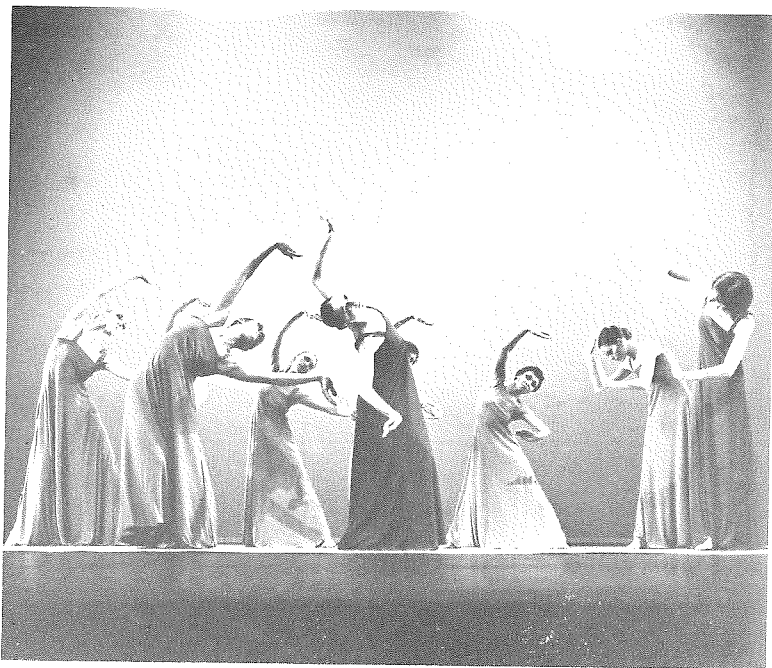
Scène uit: 'Stabat Mater' (1975)