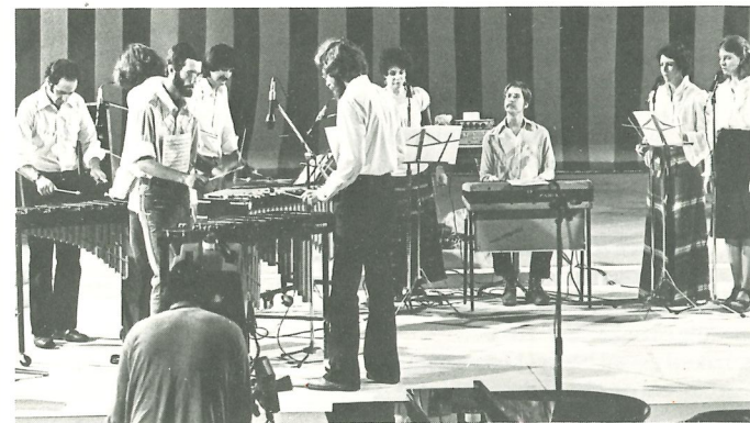
Steve Reich Ensemble 'Music for Mallet Instruments, Voices & Organ'.

Music for a Large Ensemble (1978) is een ontwikkeling van twee van mijn vroegere werken, Music for Mallet Instruments, Voices and Organ (1973) en Music for 18 Musicians (1976). De bezetting is de grootste die ik ooit gebruikt heb en bevat alle orkestrale groepen: strijkers, hout- en koperblazers, slagwerk, waaraan toegevoegd vrouwenstemmen. Alle instrumenten worden akoestisch bespeeld; de strijkers, blazers, piano's en zangeressen worden versterkt met microfoons. Het stuk heeft vijf secties die elk een soort boog vormen (A-B-C-B-A). Aan het begin zijn er wat kortere zinnen, die door augmentatie langer worden en vervolgens, door diminutie, weer naar hun oorspronkelijke lengte terugkeren. Op dat moment verandert de toonaard en/of de maatsoort en begint de volgende sectie. In het midden van elke sectie zijn er wat langere en versierende melodische lijnen waarneembaar in de klarinetten en in de eerste viool: deze zijn kenmerkend voor mijn groeiende belangstelling voor wat langere en meer traditioneel georiënteerde melodieën. Deze belangstelling wortelt in mijn vroege stukken en in mijn