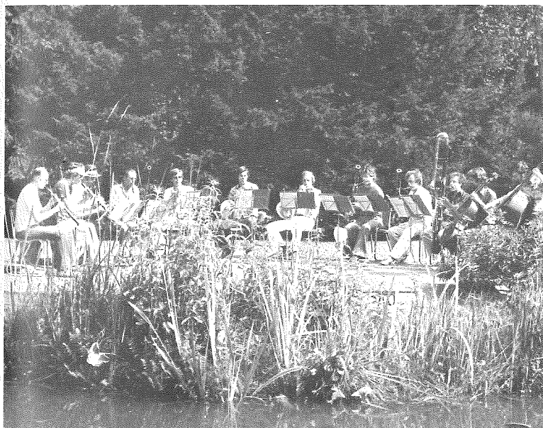
Boven: Steve Reich Ensemble 'Drumming'. Onder: Nederlands Blazersensemble.