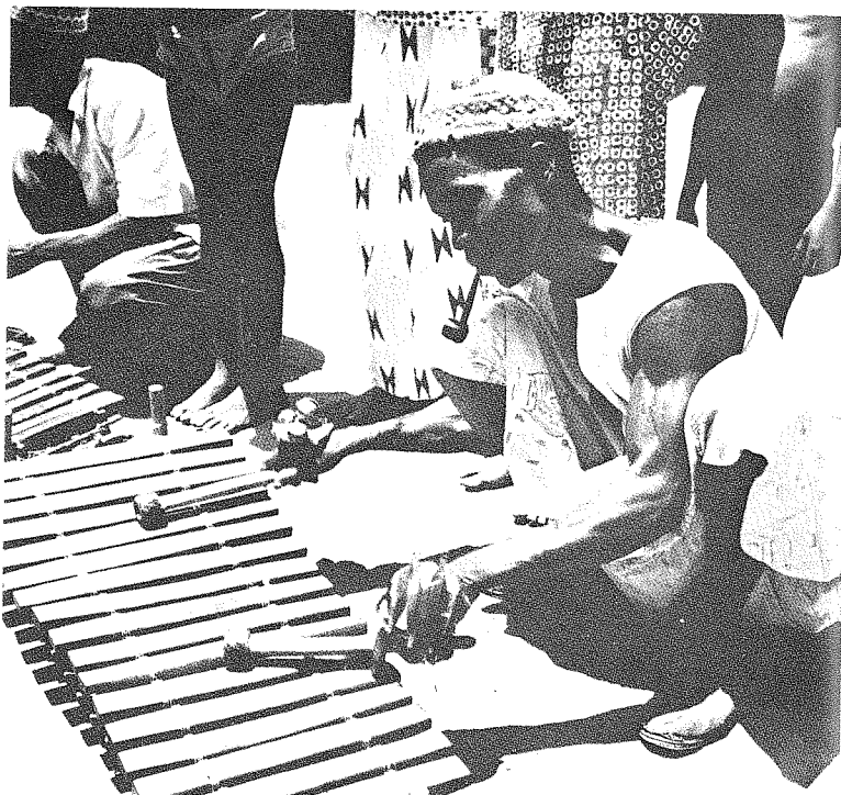
Xylofoon, Guinea, zonder calebas.

Het programma wordt gelardeerd met volksliedjes uit verschillende delen van Nigeria.