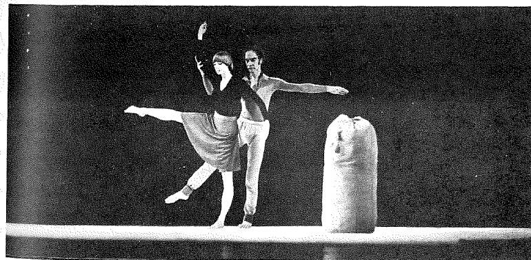
Squaregame (1976) Dansers: Merce Cunningham en Karole Armitage.